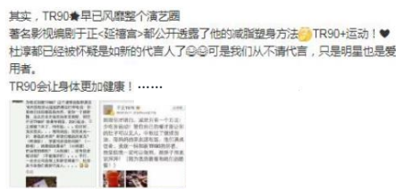
错误借用公众人物推广

来自癌症病人的好消息 我有一位朋友，41岁时被诊断出子宫颈癌晚期。医生告诉她只剩下3个月的生命了。在化疗期间她食用了R 2 和华茂的产品。除了因为化疗正常的脱发，她整个人看起来都很精神。曾经有一个护士居然把陪同她复查的姐姐误认为是癌症病人。在两次复查以后，医生非常惊讶地发现癌细胞都消失了。